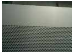
バンチングプレス製品