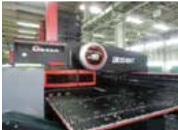
CNCタレットパンチプレス