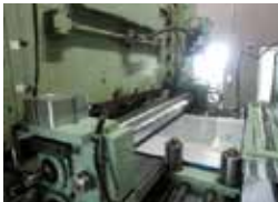
バンチングプレスライン