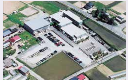
仙台工場・開発研究所