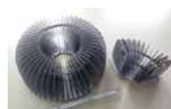
LED照明用ヒートシンク