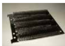
コイルゲートフィンヒートシンク