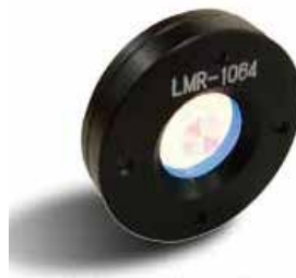
軸対称フォトニック結晶