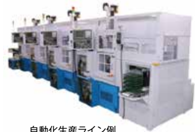
自動化生産ライン例