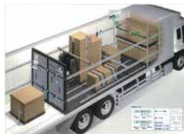
カーゴコントロール製品