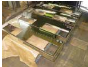
SUS鏡面材の板金溶接品