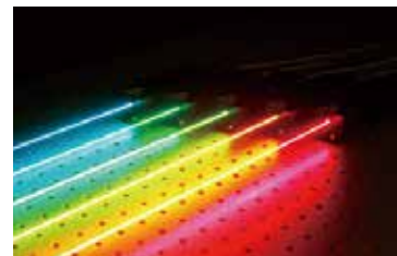
SHG Bulk PPLN-Unit