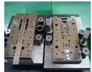
プレス金型設計／製作