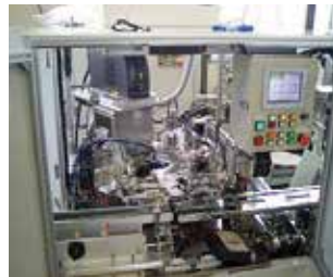
省力化機器設計／製作