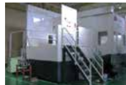
横型中線マシニングセンター