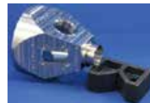
SUSチャンバー 削り出し