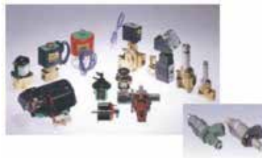
電磁ステンレス鋼の製品例