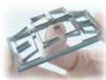
【精密微細切削加工品】