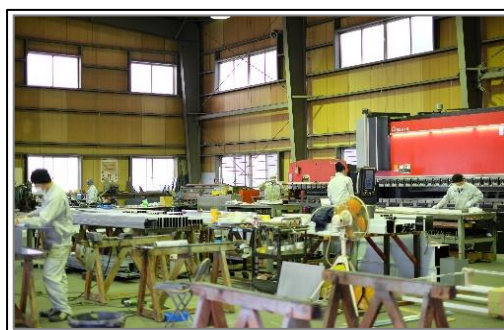
「のこすモノ・つくるヒト」工場作業風景