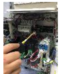
配電盤加工の様子

現在、本社をみやぎ復興パークに移し、組立・調整・配送業務等を行っているほか、松山事業所では、メカ組立・電気配線等を行っており、顧客満足度向上に向けて社員一丸となり奮闘しているところです。