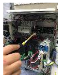
配電盤加工の様子

現在、本社をみやぎ復興パークに移し、組立・調整・配送業務等を行っているほか、松山事業所では、メカ組立・電気配線等を行っており、顧客満足度向上に向けて社員一丸となり奮闘しているところです。