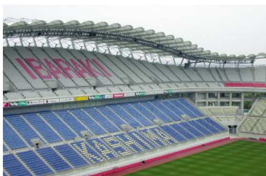
〔施工例：ドーム屋根〕

販路N a V i 事業（販路ナビ） は、販路開拓ナビゲーターを活用し首都圏等を中心とした取引見込み先への引合せを支援する制度です。