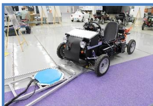
ワイヤレス給電設備