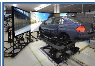
ドライビング シミュレータ