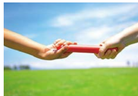
【事業承継の意向別の割合】(60代以上)

宮城県事業承継・引継ぎ支援センターは、そんな方のご相談に対してアドバイスを 行う公的支援機関です。事業引継ぎに精通した専門家(弁護士、公認会計士 等)が無料でお話を伺いますので、お気軽にご相談ください。国(東北経済産業 局)から委託を受けた事業なので、安心してご相談いただけます。