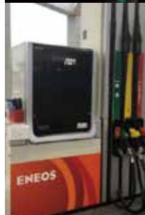
【給油機用電磁弁コイル】