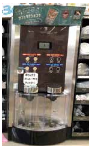
【コーヒーサーバー用電磁弁コイル】