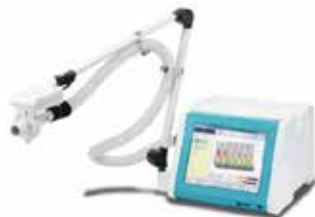
【総合呼吸測定装置】