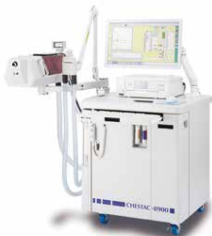
【呼吸機能検査装置】 CHESTAC-8900