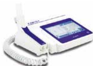
【電子スパイロメーター】 CHESTGRAPH HI-301U