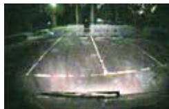
【通常カメラと高感度カメラ(下)画像比較】 車のテールランプのみの明るさでの画像