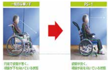
【高齢者福祉施設用車椅子 P S・1】