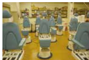
【耳鼻科用治療椅子】