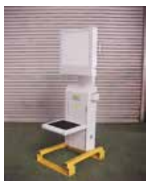
【X線撮影用油圧駆動架台】