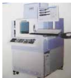
【X線非破壊検査装置】