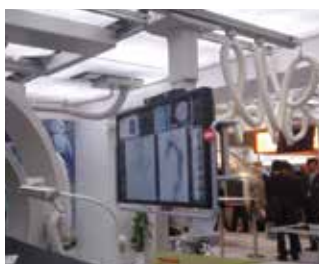
【56インチ天井吊モニター】