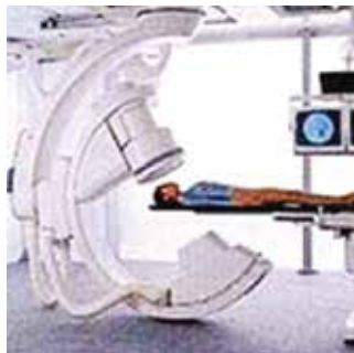
【循環器系X線診断装置】