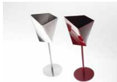
【切削加工のワイングラス】（一体物）