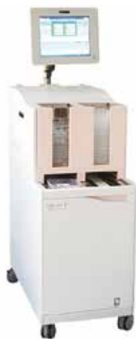
【olpaso.1】 オールインワン型採血管準備システム