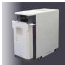
【Pal TUBO6】 ポータブル型採血管 ラベリング装置