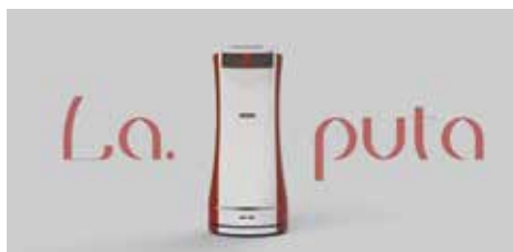
【La.puta】 自律自走式の搬送ロボット