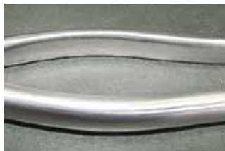
【医療用器具 (ヘアライン仕上げ)】