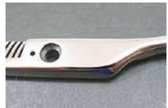
【理・美容はさみ (鏡面仕上げ)】