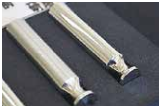
【医療用部品 (ナノ研磨)】