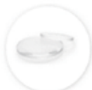
光学レンズ 製造・販売