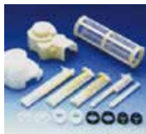
【フィルター成形品】