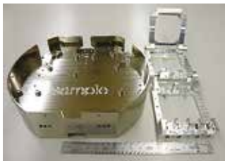
【マシニングセンタ加工品サンプル】