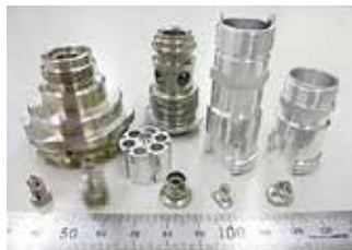
【太物加工品サンプル】