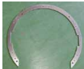
[SUS φ 520mm]