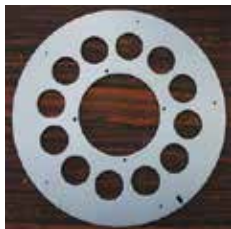
[SUS φ 260mm]