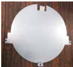
[SUS φ 330mm]