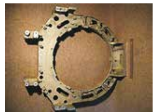
【医療機器用部品例 (物差しのサイズは500mm)】