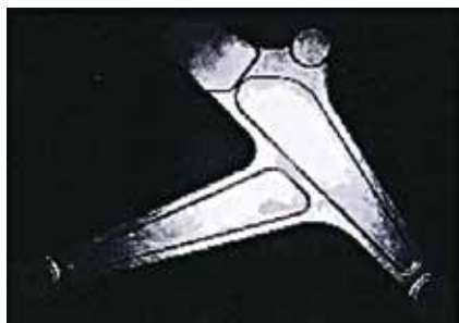
【メインフレーム (介護用品)】