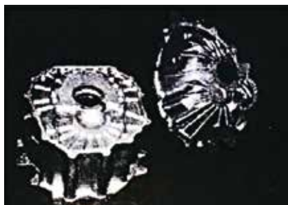
【ハウジング クラッチ】