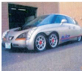
【慶応義塾大学電気自動車研究室との 8輪電気自動車開発プロジェクト】