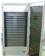
【細菌検査システム開発 プロジェクト】