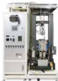
【環境制御型高温特性評価装置】