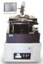
【全方位磁界プローバ】