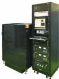
【高感度薄膜磁歪測定装置】