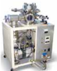
【超高真空摩擦試験機】