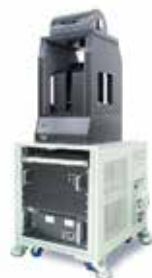
【振動試料型磁力計 VSM】