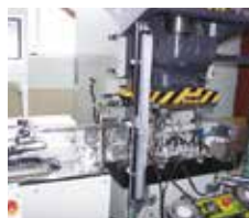
【省力化機器の設計・製作】