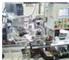
【省力化機器の設計・製作】