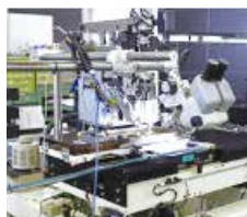
【省力化機器の設計・製作】