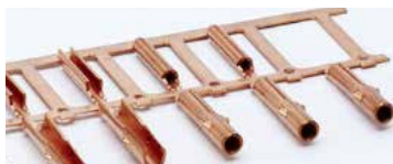
【精密プレス加工品】