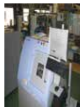
【X線非破壊検査装置】