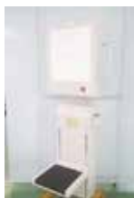
【人体上下スタンド】