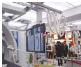
【56インチモニター天吊り装置】