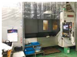
【マシニングセンタ】