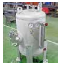
【ステンレスタンク】