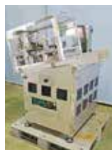
【銀鮭自動活メ装置】