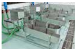
【牡蠣むき身洗浄装置】