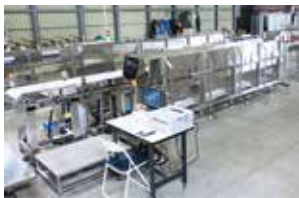
【非破壊式食品放射能測定システム】 東北大学 / ㈱コメット / ㈱三益 共同開発