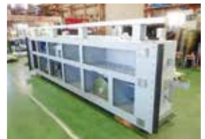
【アルミ合金製横引ゲート】