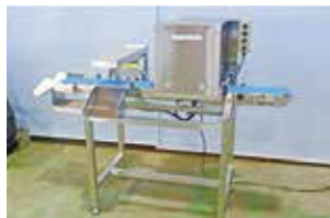
【牡蠣形状選別装置】