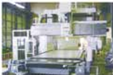
【5面加工型マシニング】