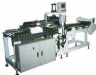
【きりもち製造装置】