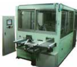
【自動バフ掛け装置】