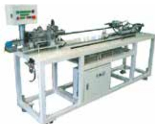
【アルミサッシ用ゴムシール送入機】