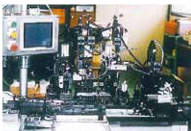
【製品組立装置ライン】