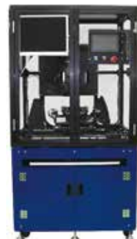
【多面画像検査装置】