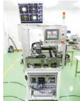
【簡易卓上チップマウンター】