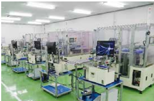
【自動機・省人化装置】