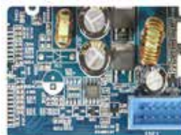
車載ECU(ボディー系)開発