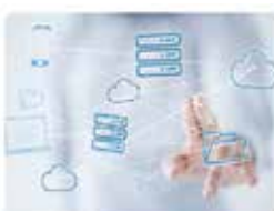
検索基盤インフラ構築作業