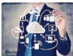
仮想基盤構築作業