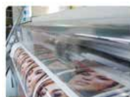
ミニプリンタ及び航空用プリンタファームウェア開発