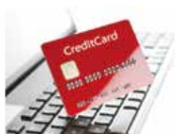
公共系の授業料徴収システム