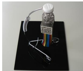
県内製造業の女性経営者中心で製作した「ORIHIMEランプ」