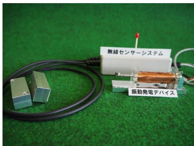
写真・図タイトル