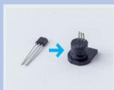
小型部品も丸ごと封止