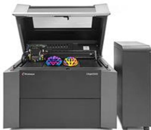
5台のハイエンド3Dプリンタを所有